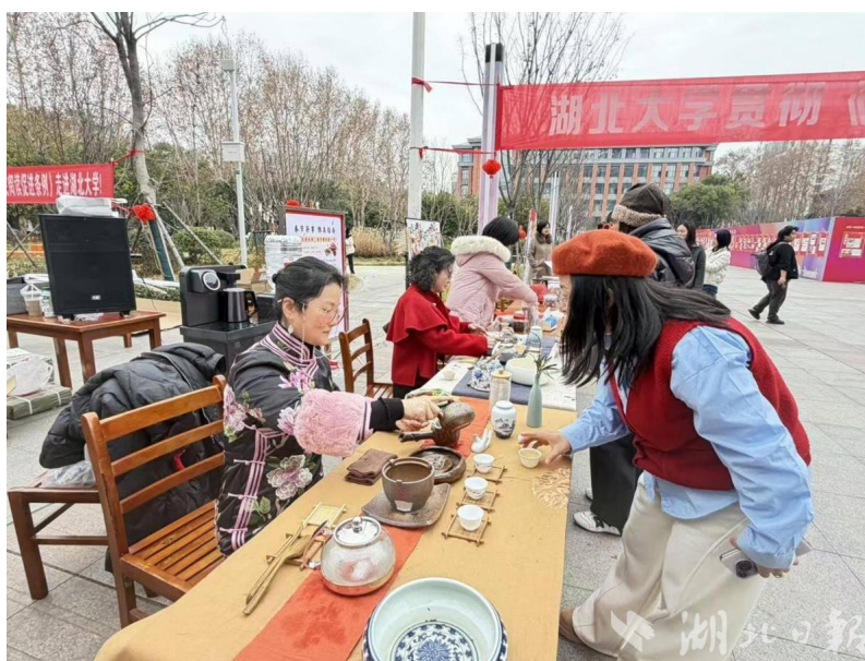
茶艺品鉴。

资源宣传区中，通过实物展示、资料发放、现场答疑等形式，集中展示了图书馆各类数字资源与全民阅读推广活动，鼓励师生积极利用馆藏资源，提升信息素养与阅读素养。