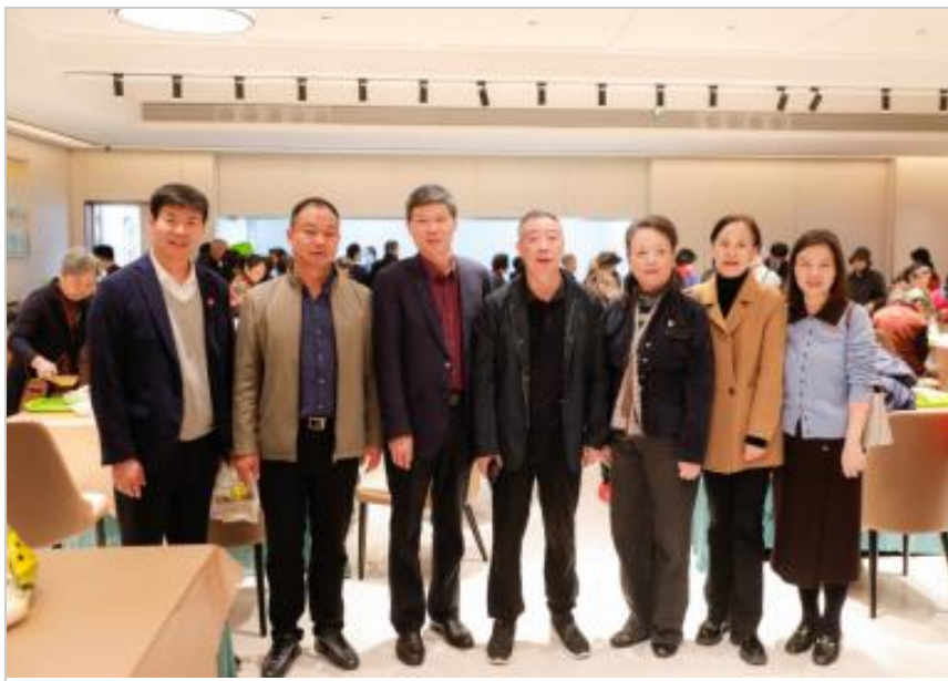
部分领导嘉宾合影留念

仪式结束后，活动进入温馨的互动体验环节。持老年卡的居民作为“首批体验官”，在志愿者引导下品尝了食堂精心准备的“小碗菜”与寓意吉祥的“重阳糕”。志愿者们贴心提供端餐服务，许多得知幸福食堂恢复营业信息的社区老人也来到餐厅参加体验活动，现场其乐融融，充满了尊老敬老的节日氛围。