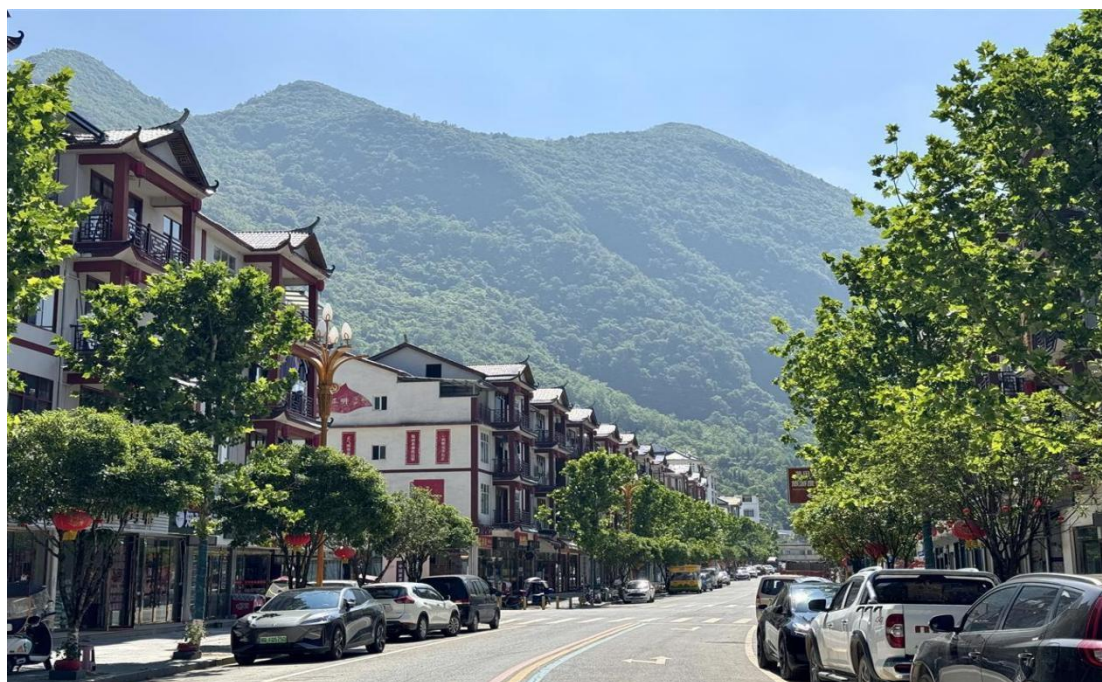
▲ 全国文明乡镇建始县茅田乡

为深入学习贯彻党和国家关于老龄工作的重要部署和习近平总书记对老龄工作的重要指示精神，获取养老服务工作新的思想元素，探索健康养老新途径，校老协、老教协组织两协委员赴鄂西地区调研乡村振兴和健康养老服务业情况，结合我校离退休老同志健康养老的实际，探寻新的工作思路，努力促进我校养老服务工作。