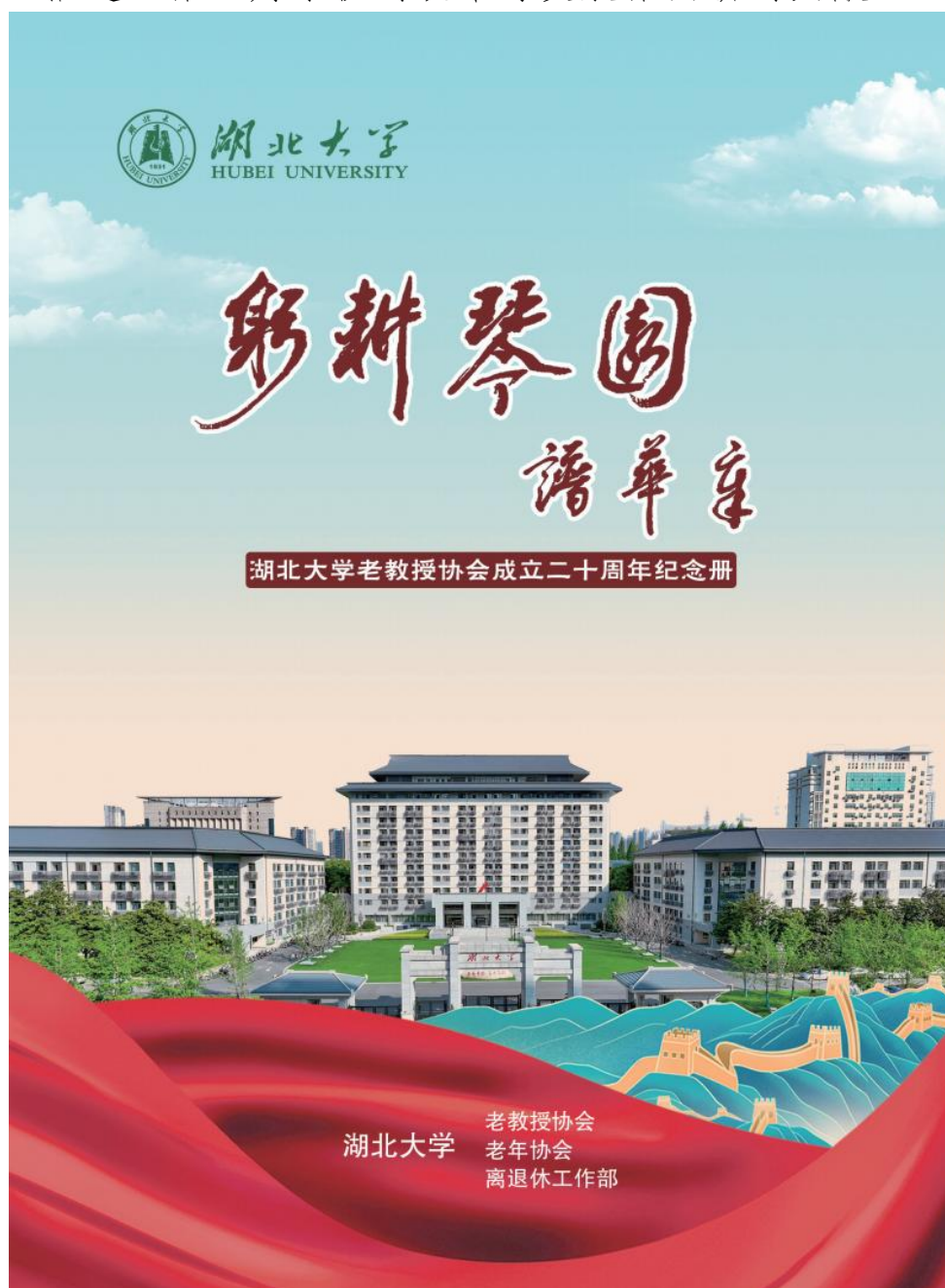
▲湖北大学老教授协会成立二十周年纪念册封面

老教协还通过举办展览，以文字、图片和音像制品等形式，展出老教协二十年来的发展历程及其主要工作，凸现老有所为活动和学术成果。召开老教授协会成立二十周年纪念大会，全面总结老教授协会二十年来的主要工作及其经验，营造老有所为工作氛围，以协会成立二十周年纪念活动为契机，进一步谋划未来，推进工作，为学校的改革与发展作出新的贡献。