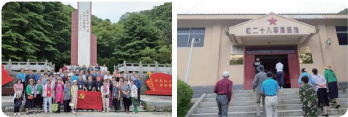
▲离退休党员骨干参观红二十八军军部旧址

2024年6月4日至5日，离退休党员骨干60余人，先后参观了安徽红二十八军军部旧址、湖北大学帮扶点英山县石头咀镇大屋冲村、英山县神峰山庄及生态农业园等，缅怀革命先烈，接受革命传统教育，了解党和国家关于乡村振兴战略引起的山乡巨变，感受乡村振兴的宏伟壮举。