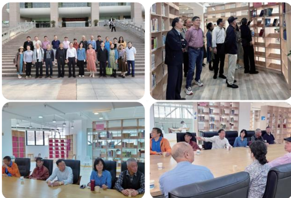
▲老同志参观湖北大学图书馆

代化的图书馆，以及专门收集和保存本校教职工、校友的专著论文及其科研成果的特藏书刊陈列馆，纷纷竖起大拇指深表赞赏。特别是在书橱中看到特藏书刊的作者都是曾经的同事和友人时，大家倍感亲切和熟悉。也有同行的老教授在精品文库中看到自己的著作、作品等，他们为曾经所做出的贡献感到欣慰和自豪。