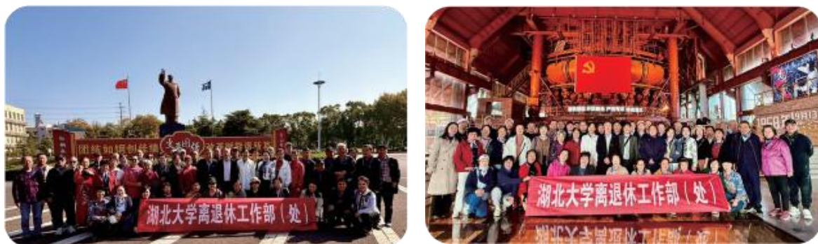
▲ 离退休骨干参观原武钢一号高炉